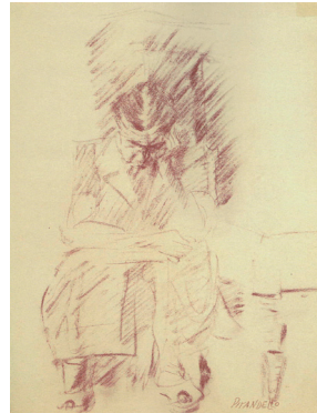
Fausto Pirandello: Figura seduta , sanguigna su carta

Samstag, 02. Dezember 2017 Senatssaal der Universität Bonn